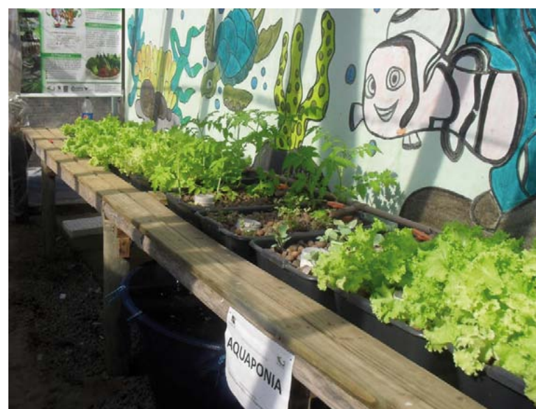
Figura 3 – Aquaponia de pequena escala na escola parceira da UDESC Gregório Manoel de Bem, localizada no Ribeirão Pequeno.