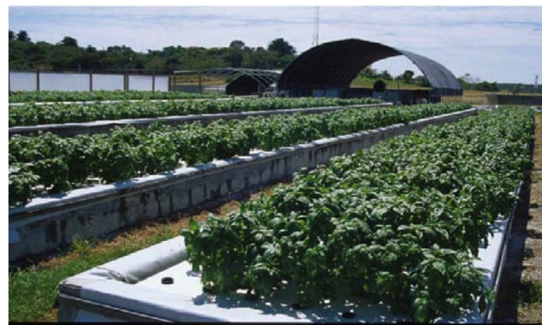
Figura 1 – Aquaponia em escala comercial na região do Caribe.

E quais as perspectivas desse sistema? Dentro do contexto atual onde enfrentamos uma grave crise hídrica, geográfica e populacional, a necessidade de alternativas para satisfazer a demanda de alimentos é eminente. Por essas e outras razões a aquaponia vem experimentando uma expansão generalizada pelo mundo. Regiões brasileiras como o nordeste, e mais recentemente o sul e sudeste, poderão claramente se beneficiar deste tipo de sistema. Além disso, a diversificação e o rápido giro financeiro, atrelado aos preços mais altos de venda devido ao valor agregado dos produtos, chamam cada vez mais a atenção dos produtores. É a "salada" invadindo o território dos peixes onde todos ganham!