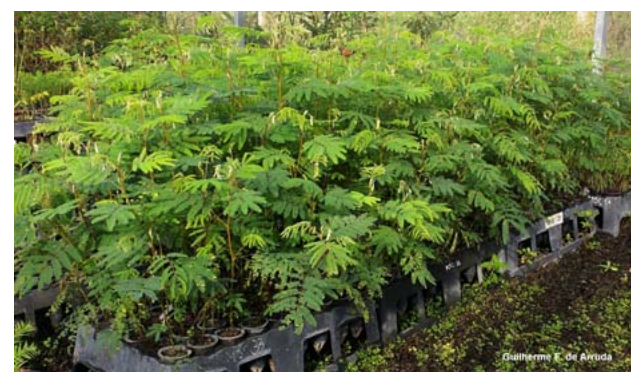
Fig. 2 - Mudas de Bracatinga