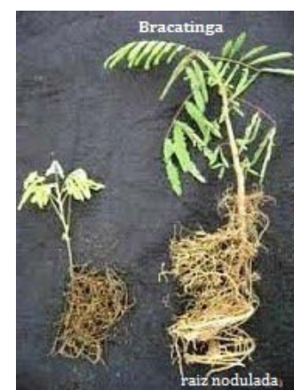
Fig. 3 - Bracatinga com raiz nodulada por Rhizobium

Progr. Pós Grad. em Produção Vegetal-UDESC/Lages,SC: 1Eng.Florestal, Doutorando; 2Bióloga, Doutoranda; 3Bióloga, Mestranda; 4Eng.Agrônomo, Mestrando; 5Eng.Florestal, Mestranda; 6Eng.Agrônomo, Prof. Pós Doutor.