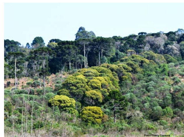
Fig. 1 - Agrupamento de Bracatingas (bracatingal)

[3] CHIARANDA, R et al. Crescimento das árvores e deposição de folhas em talhões florestais plantados em solos alterados pela mineração do xisto. IPEF, Piracicaba, n. 25, p. 25-28, 1983.