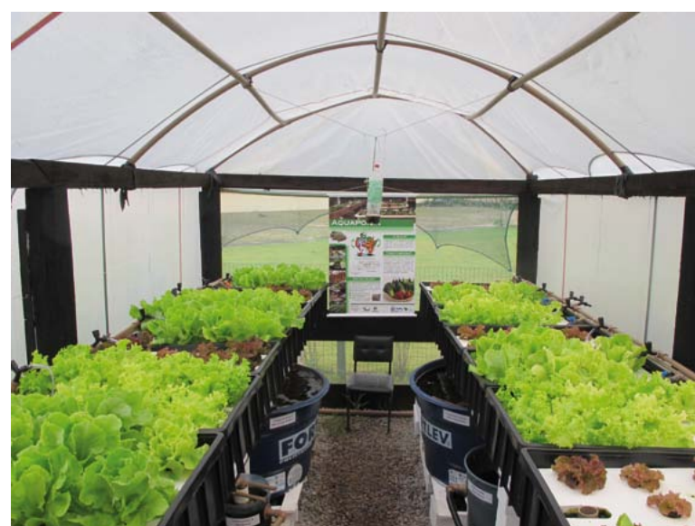
Figura 2 – Estufa Piloto de Pesquisas em Aquaponia da UDESC/Laguna-SC