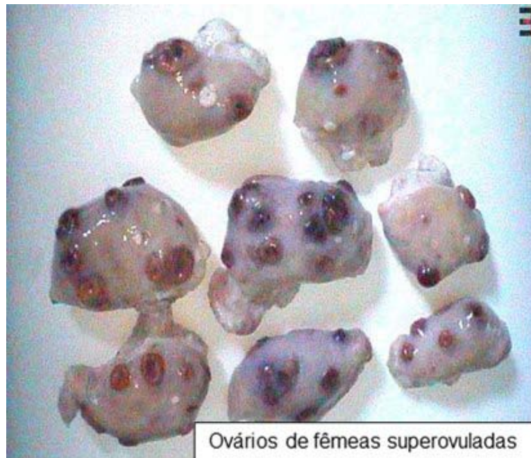
Ovários de fêmeas superovuladas

• A doadora deve possuir características genéticas e produtivas superiores, pois este animal é fonte do material genético que se deseja multiplicar. Deve ser um animal de morfologia e genética extremamente acima da média do rebanho