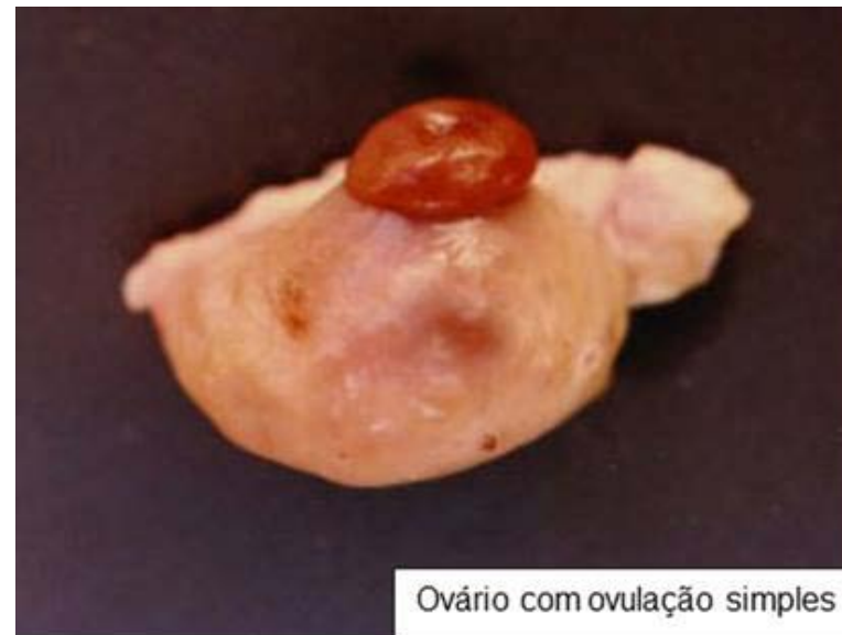
Ovário com ovulação simples

ral: Inúmeros trabalhos de pesquisa apontam os efeitos do escore corporal sobre a fertilidade dos bovinos. Em doadoras, este efeito se expressa nos resultados da superovulação e também na viabilidade dos embriões coletados. Numa classificação de até 5, o ideal seria um escore entre 3 e 4.