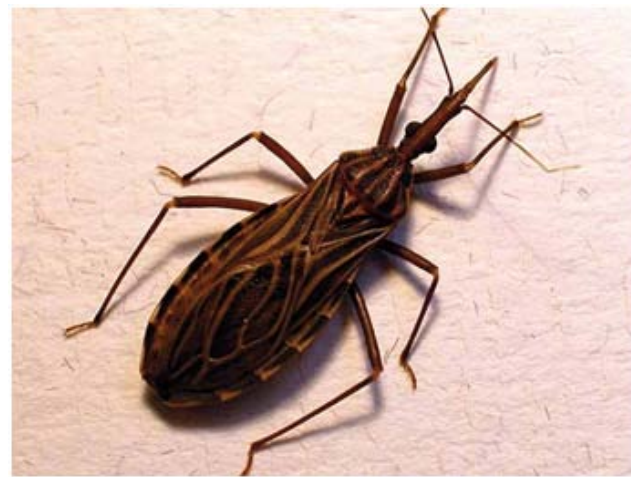
Figura 2: Barbeiro, espécie de triatomíneo vetor da Doença de Chagas.