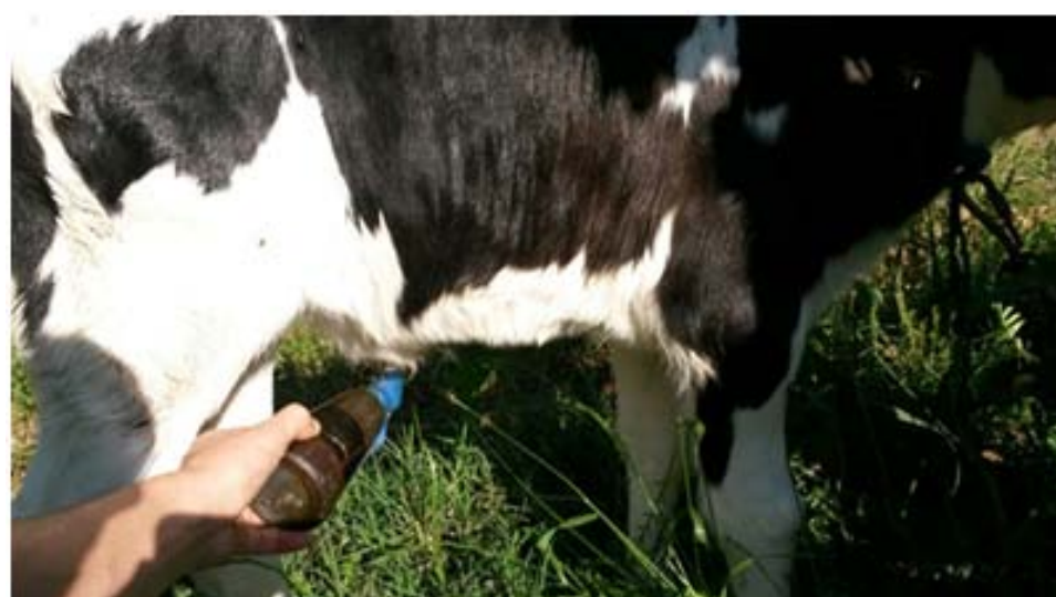
Figura 01- Manejo de cura de umbigo: prática de desinfecção com iodo.

5- Bem estar animal: Deve-se evitar ao máximo o estresse, que pode ocorrer em alguns mane-