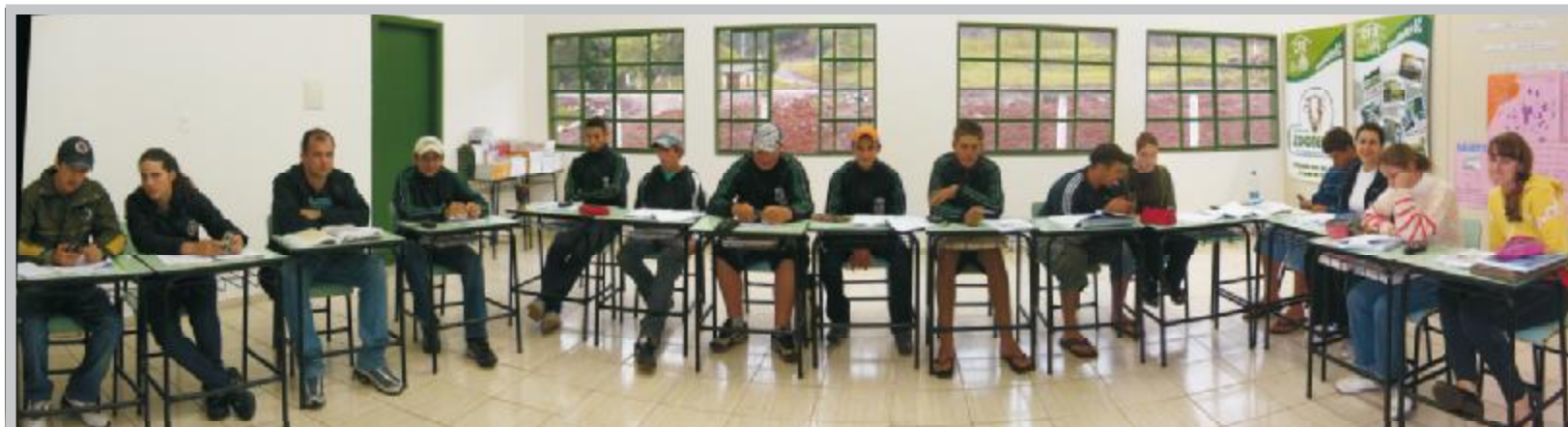
Estudantes da Associação Casa Familiar Rural de Saudades – SC durante aula teórica.