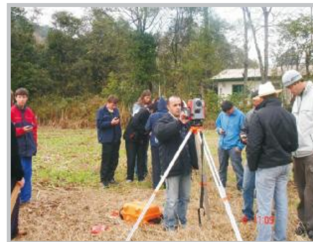
Estudantes durante aula prática do curso.

Endereço para contato: edirof@hotmail.com ou petzouudesc@hotmail.com